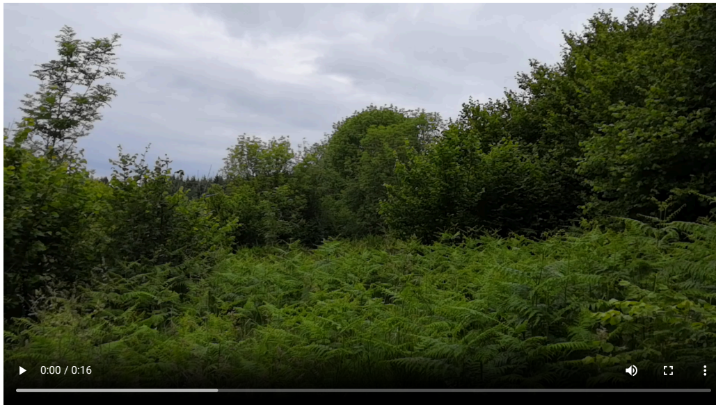
Le terrain lors de notre première visite : des ronces et des fougères à hauteur d'homme

N'oubliez pas qu'il y a une possibilité que le terrain convoité soit préempté par la SAFER... ceci étant, si ledit terrain est en friche, mal placé d'un point de vue agricole et délaissé, il y a peu de chance qu'il intéresse soudainement nos amis agriculteurs locaux. Le délai de préemption est de 2 mois. Les différentes démarches mises bout à bout.... prévoyez plutôt 4-5 mois pour officialiser votre achat que 2 mois (surtout avec le contexte Covid que nous connaissons actuellement). Admettons.... voilà ...c'est fait !! on a (vous avez votre) notre terrain.... Retrouvons nous les manches et réfléchissons !!